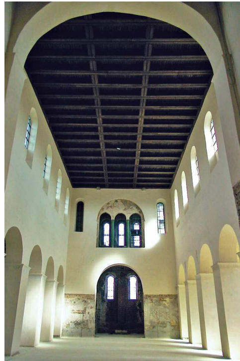
Zicht op de gerestaureerde middenbeuk en het oostkoor van de Ottoonse Sint-Laurentiuskerk. Het koor is opmerkelijk omwille van zijn twee verdiepingen, zijn blindnissen en de muurschildering van een "Majestas Domini" in het boogveld van de driedubbele arcade.