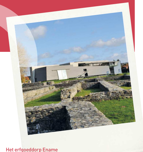
Het erfgoeddorp Ename Provinciaal Archeologisch Museum | Lijnwaadmarkt 20 9700 Oudenaarde-Ename | België www.ename974.org www.enamecenter.org

Création d'un centre d'expertise de sites archéologiques. Het creëren van een centrum van expertise op het gebied archeologische vindplaatsen. Creating a center of expertise in archaeological sites.