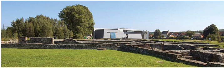
2. Vue générale du village patrimonial d'Ename. Algemeen zicht op het erfgoeddorp Ename. General view of the heritage village Ename.