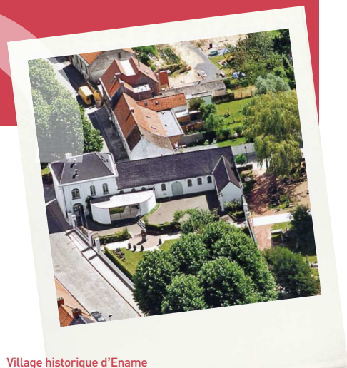
Village historique d'Ename Provinciaal Archeologisch Museum Lijnwaadmarkt 20 9700 Oudenaarde-Ename | België www.ename974.org www.enamecenter.org

Hôtel particulier du XIX e siècle transformé en musée. 19 de -eeuwse herenhuis omgebouwd tot een museum. A 19 th century mansion was converted in museum.