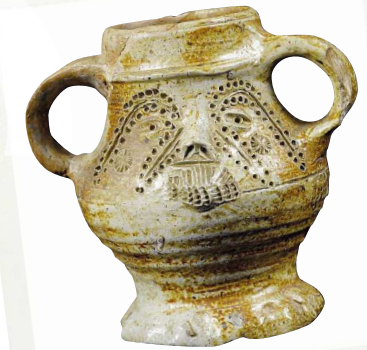
Raeren Stoneware Töpfermuseum Raeren | Burgstraße 103 4730 Raeren | Belgium www.toepfermuseum.org